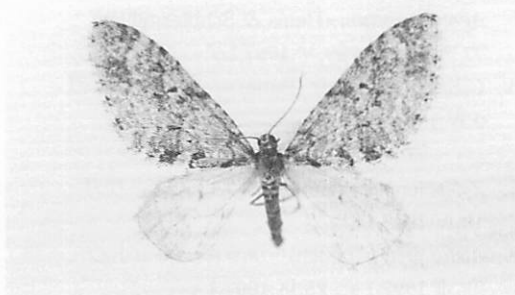
Fig.2. Trichopteryx miracula Inoue ウスミドリコバナナミシャク