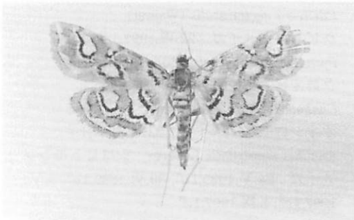
Fig.1. Nymphula separatalis (Leech) クロスジマダラミズメイガ

で散発的に記録されているが局地的で少ない種である。兵庫県ではあまり例がないと思われる。