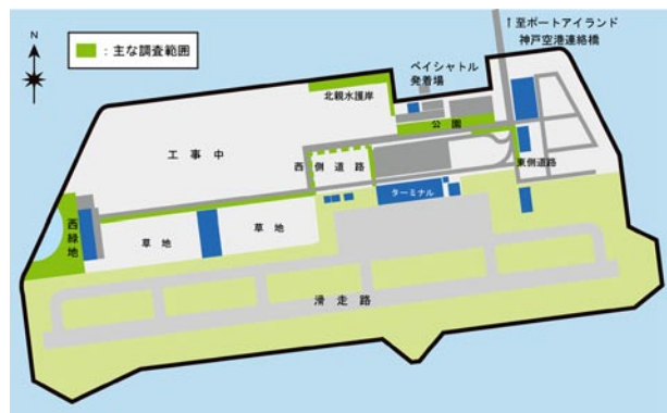
図1 神戸空港島の概略図。

調査はできるだけ晴天で風の弱い条件のよい日、特に晩秋から早春にかけては気温の高い日を選んで行った。