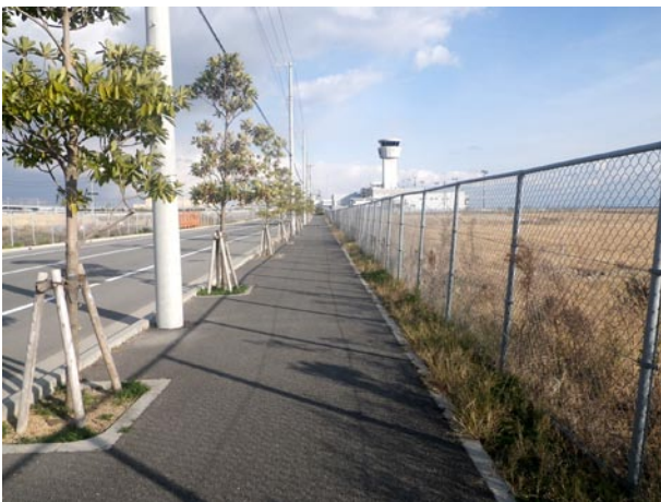
写真3 西側道路 (1).