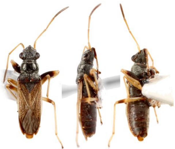
写真7 ホソヒョウタンナガカメムシ.

伴光哲氏の同定による. 石川ほか (2012) によると, これまで国内では四国・九州及び南西諸島から記録されており, 本州初記録となる. ただし, 前述のとおりどこから侵入したかについては不明である.