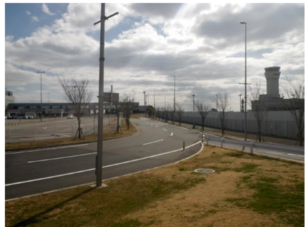
写真4 西側道路 (2).