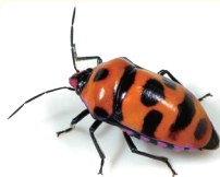
オオキンカメムシ