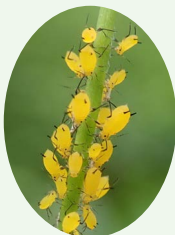
キョウチクトウアブラムシ