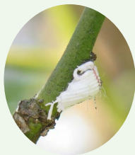
イセリアカイガラムシ