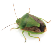
チャバネアオカメムシ