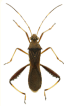
ホソヘリカメムシ