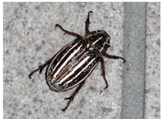
写真2 シロスジコガネ(メス). 2013年6月15日, 淡路市久留麻