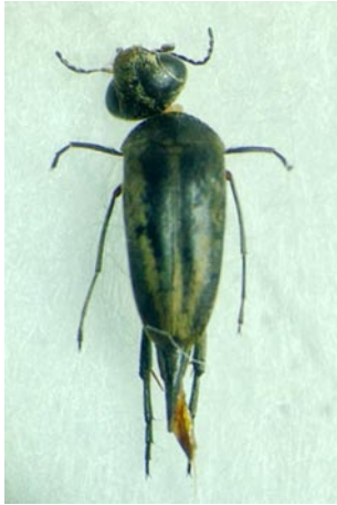
1ex., 兵庫県宝塚市玉瀬武田尾, 11.VII.2013

筆者は、兵庫県下の記録が少ないと思われるハナノミ Mordellaria hananoi を採集したので報告する。