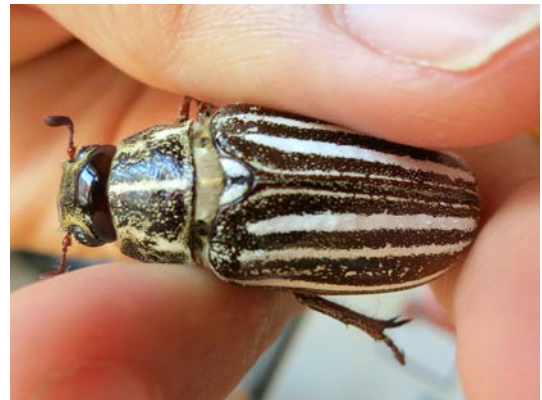
写真1 シロスジコガネ(メス). 2013年6月14日, 淡路市久留麻

まず2013年6月14日午前1時30分ごろ、淡路市久留麻の国道28号線沿いにあるマンション玄関にて、メス1個体を確認した(写真1)。マンションの街灯に誘引されたものと思われる。前日から確認時までの天候は晴れであった。写真を撮影してから捕獲したが、翌朝、採集地点近隣の海浜で放した。