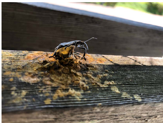
図2 加古郡播磨町大中, 2019年7月24日.

同地に営巣したキムネクマバチの巣穴直下に、やや湿った様相の黄色物質が落下しており、そこに本種の幼虫が口吻をさし込んでいる状況を確認した。事例1と同様、頭部を小刻みに震わせており、吸汁と判断した。当時、キムネクマバチの巣内では蜂が営巣活動中であり、黄色物は巣穴直下にあったことから、巣内から落下もしくは排出された花粉などを含んでいた可能性が高いと思われる。