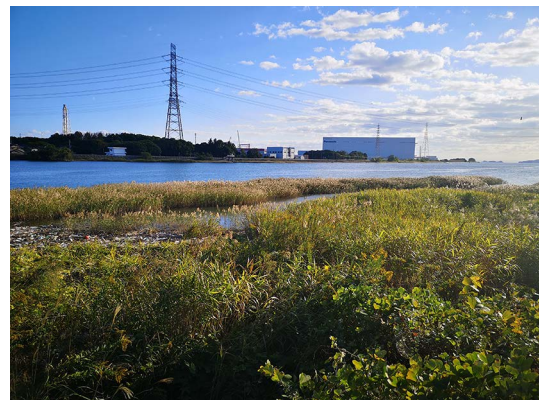
図2 市川河口の採集場所.

場所は、兵庫県姫路市飾磨区中島2626、浜手緑地近辺の市川河口付近の河川敷 (GPS座標: 34.78823, 134.68609, 図2) で平坦な砂利の上に倒れた枯れ枝に静止した個体を採集した。周囲を探索したが、他の個体は見られず、また国道を隔てた緑地には、繁殖に適した野鳥観察池もあるが、この場所で同日に他のトンボも見られていない事から、この雄は単独で飛来したものと考えられる。