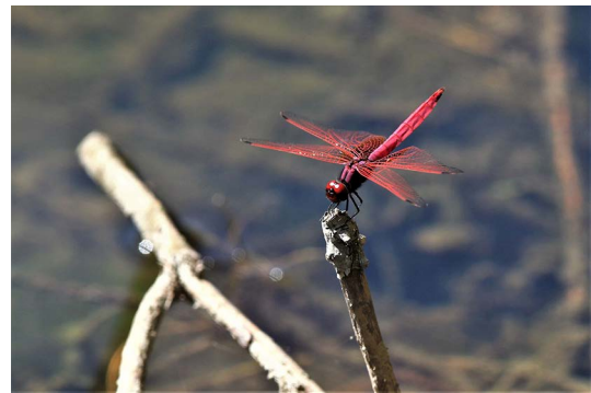
図2 2019年10月9日 11時37分 撮影.