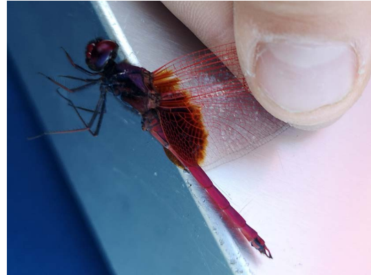
図1 1♂ 兵庫県姫路市飾磨区中島 2019.XI.4.

2019年11月4日、兵庫県では3例目、(2016神戸市, 2017淡路島) 姫路市では初記録となる、ベニトンボ Tritheimis aurora (Bermeister 1839), 1♂ (図1) を採集したので報告する。