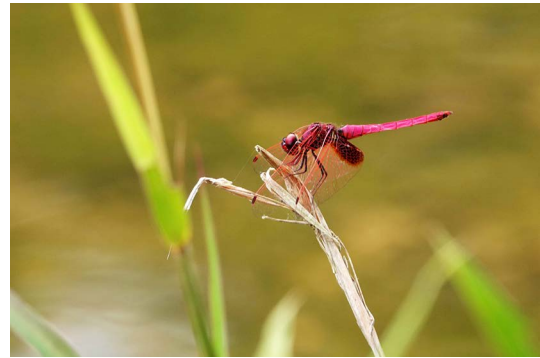
図1 2019年10月6日 15時35分 撮影.