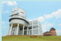
⑧ 西はりま天文台公園（大撫山） 天体観測や宿泊ができる。天文台には、世界最大の公開望遠鏡「なゆた」がある。