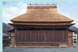
⑤ 上三河の舞台 国指定重要有形民俗文化財の農村舞台。