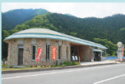
③ 南光ひまわり館 地元食材を使った特産品を製造販売。喫茶軽食コーナーも。