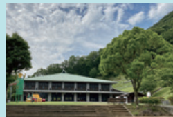
⑨ 笹ヶ丘公園 大きなすべり台があり、宿泊や日帰り入浴もできる。徒歩30分ほどで浅瀬山城跡展望台へ。