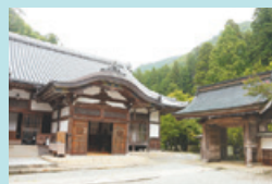
① 船越山 南光坊 瑠璃寺（るりじ） 高野山真言宗別格本山の名刹。