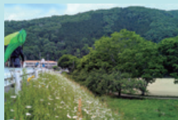
⑥ 南光スポーツ公園 グラウンドや体育館がある広い公園です。7月のひまわり祭りではメイン会場となります。