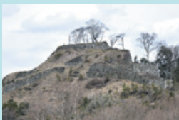
⑦ 利神（りかん）城跡 2017年に国史跡に指定。その威容から、雲突城（くもつきじょう）とも呼ばれる。 ※ 安全のため登城は遠慮下さい。