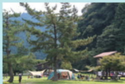
④ 南光自然観察村（キャンプ場） 千種川のほとりにあるオールシーズン対応のキャンプ場。