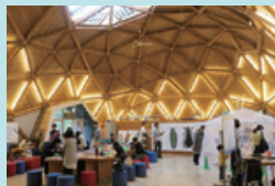
⑩ ひょうご環境体験館 地球温暖化をはじめとする環境問題について「気づき」「学び」「知る」ことができる体験型環境学習施設。